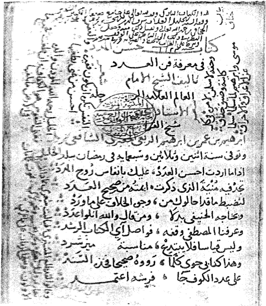
صورة لوجه ورقة العنوان لمخطوطة صنعاء، والتي هي الأصل